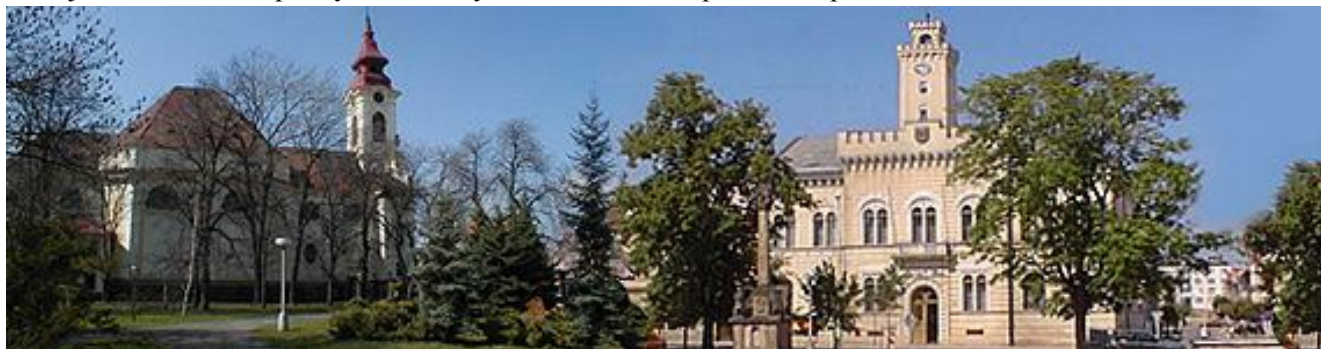
Zleva: Kostel Nanebevzetí Panny Marie, Radnice

Smrt krále Václava IV. v srpnu roku 1419 znamenala pád poslední hráze proti sílícímu neklidu a revolučním náladám. Faktické bezvládní a neustálé násilné střety poskytovaly mnoho možností k obohacení i k vyřizování účtů a jednou z četných obětí neklidné doby se stal i postoloprtský klášter. Opat prozíravě včas společně s mnichy a největšími cennostmi uprchl a obranu opevněného konventu přenechal profesionálním žoldněrům. V květnu roku