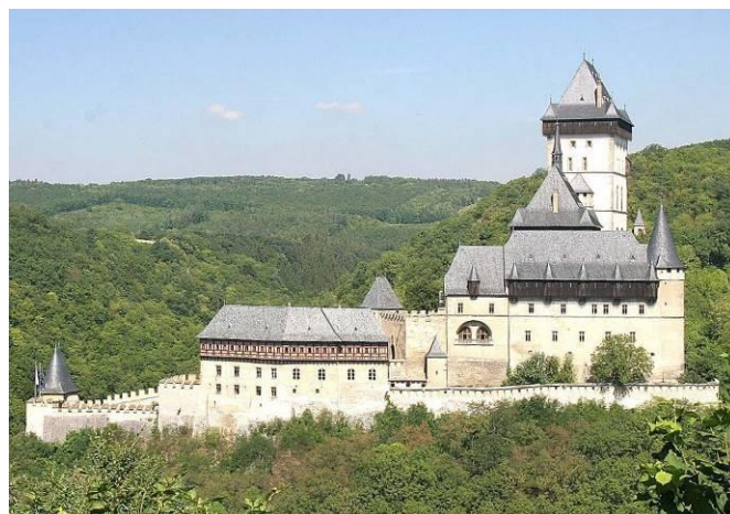
Pohled na Karlštejn od jihu z protějšího kopce. Vlevo studniční věž, uprostřed purkrabství, vpravo císařský palác, za ním Mariánská a Velká věž

vlastnictví státu a ve správě Národního památkového ústavu, Územní památkové správy v Praze. Kromě vlastních tří prohlídkových okruhů s průvodcem nabízí Karlštejn každoročně také celou řadu kulturních a společenských akcí - koncerty, divadla, výstavy, Karlštejnské kulturní léto, Královský průvod či tradiční Karlštejnské vinobraní. Hrad Karlštejn nabízí také možnost uspořádání svatebních obřadů a to buď ve svatební síni v budově Purkrabství na hlavním nádvoří (tzv. Diamantová síň), nebo v tzv. Hodovní síni v Císařském paláci, či open air stavební obřad pod Mariánskou věží. V současné době je možno navštívit tři prohlídkové okruhy. I. okruh - Soukromé a reprezentační prostory Karla IV. (Císařský palác a I. patro Mariánské věže), II. okruh - Posvátné prostory hradu vč. Kaple svatého Kříže (II. patro Mariánské věže a přízemí, 1. a 2. patro Velké věže) a nově také III. prohlídkový okruh - Vyhlídka z Velké věže (3., 4. a 5. patro Velké věže).